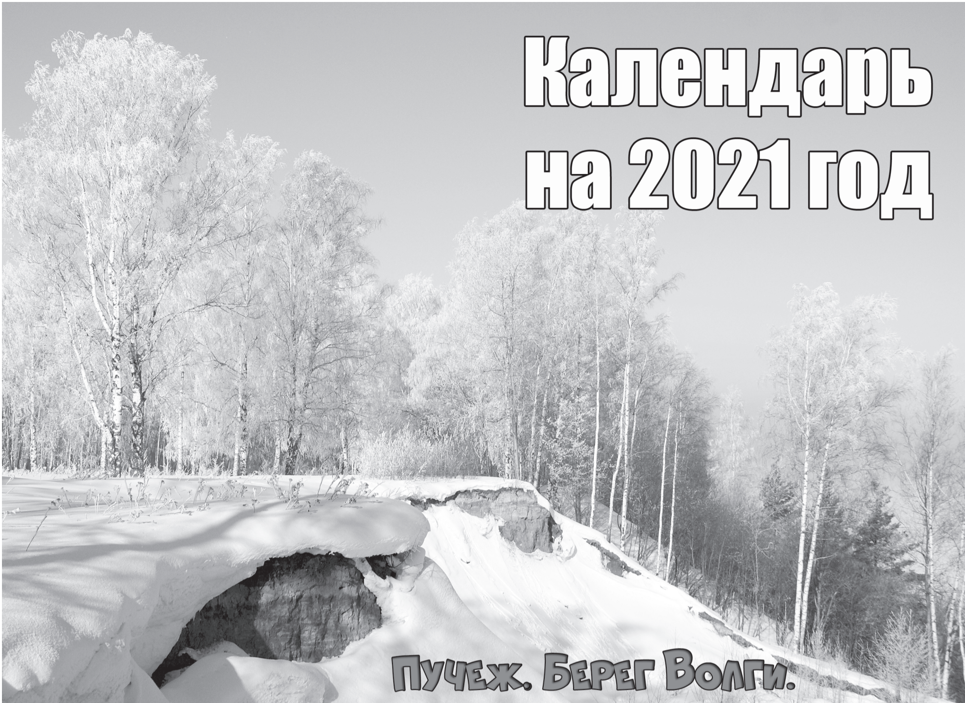
ПУЧЕЖ. БЕРЕГ ВОЛГИ.