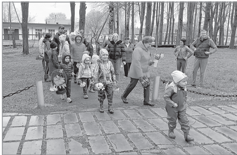
Администрации Затеихинского и Мортковского сельских поселений выражают благодарность волонтерам ОБУСО «КЦСОН по Пучежскому и Лухскому муниципальным районам», МОУ «Лицей г. Пучеж», МОУ Пучежская гимназия за оказанную помощь в проведении уборки территорий Обелиска Славы в селе Зарайское и памятника павшим воинам в д. Дмитриево Большое.

вели в августе 1942 года в г. Пучеж на барже, они были истощены и остались без родителей. Пучежане окружили их заботой и лаской. Часть ребят разместили в семье. Часть из них у нас в здании бывшей стрелочной артели. Это здание находилось напротив сельского клуба. И вот в этом здании организовали детский дом».