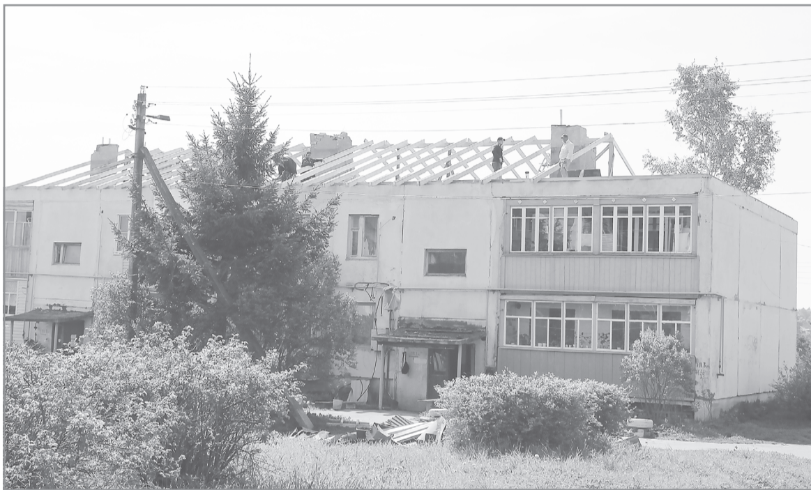
На фото: ремонт крыши многоквартирного дома в селе Сеготь

По поручению губернатора Ивановской области Станислава Воскресенского ситуация в муниципалитетах, пострадавших в результате ураганного ветра, рассмотрели на заседании комиссии по предупреждению и ликвидации чрезвычайных ситуаций и обеспечению пожарной безопасности в Ивановской области. Глава региона распорядился выделить дополнительные средства из резервного фонда муниципалитетам на восстановление социальной и жизнеобеспечивающей инфраструктуры.