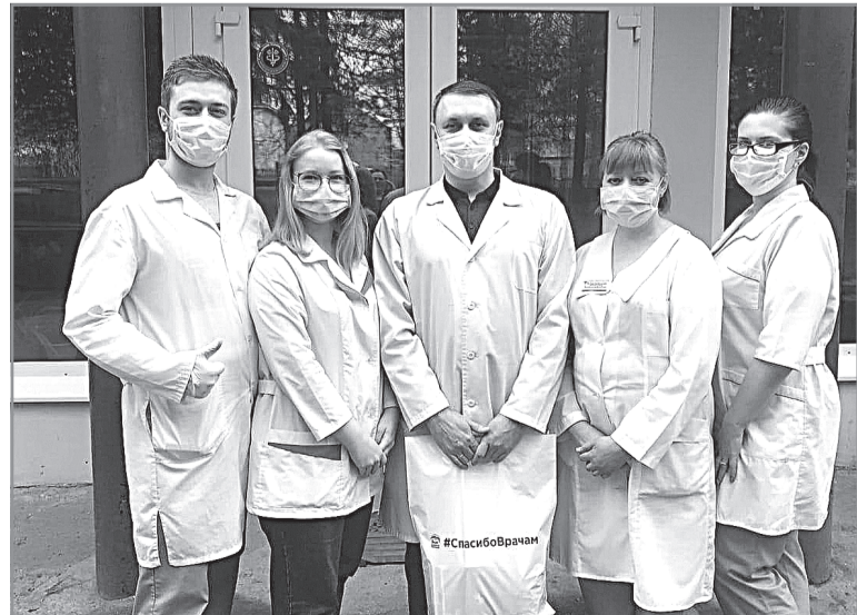
И наш регион присоединился к акции #СпасибоВрачам