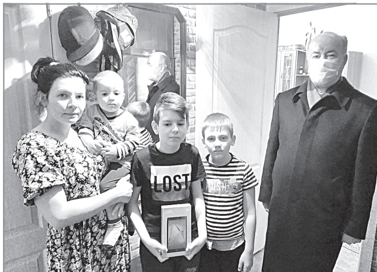
Чтобы школьники могли учиться дистанционно, партийцы дарят им гаджеты

— Сегодня главное — понять, как мы будем действовать после окончания пандемии. Жизнь не остановилась, и когда мы выйдем из режима ограничений, нужно будет продолжать работать на развитие региона. В таких условиях очень важно не тянуть одеяло на себя, а объединиться — ради помощи тем, кому особенно трудно и ради совместной работы на благо Ивановской области. И хочу добавить, что все направления волонтерской деятельности, которые у нас сейчас есть — и правовая помощь, и помощь инвалидам, останутся и будут развиваться.