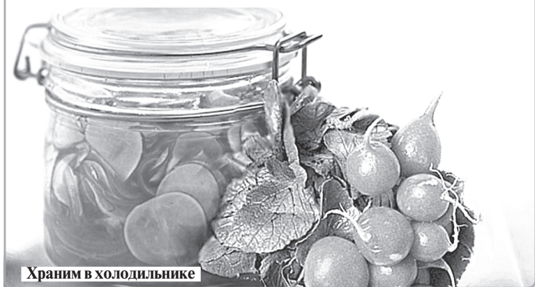
Храним в холодильнике