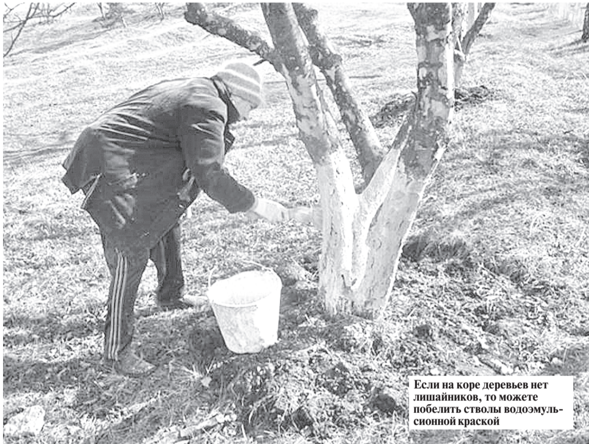
Если на коре деревьев нет лишайников, то можете побелить стволы водоземлемой краской