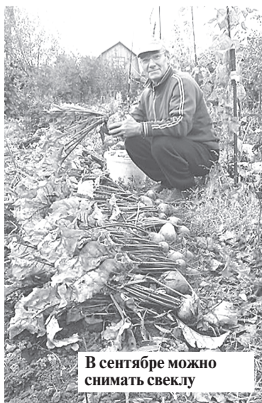
В сентябре можно снимать свеклу

В конце месяца надо срезать надземную часть пионов, флоксов, астильб, у ирисов это надо сделать так, чтобы остался веер листьев высотой примерно 15 см. Сразу после срезки полейте все эти посадки 1%-ным раствором бордоской жидкости (1 ч. ложка без верха на пол-литра воды).